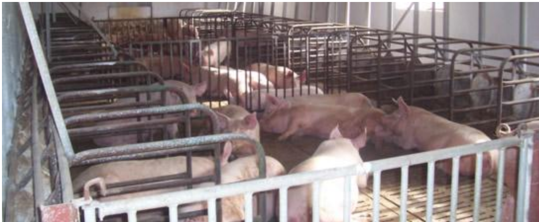
Cerdas de reposición manejadas por lotes

Sabemos lo importante que es mantener un censo ideal en una granja para conseguir los mejores resultados. Y la parte más importante de ese punto es conseguir que la reposición sea rigurosa y puntual. Debemos recordar que cuando hablamos de introducción de cerdas nuevas para reposición es necesario comprar un 10 % más de cerdas jóvenes para contrarrestar fallos existentes desde la entrada en granja hasta la cubrición real.